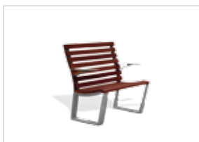
UM397S - UM397SE